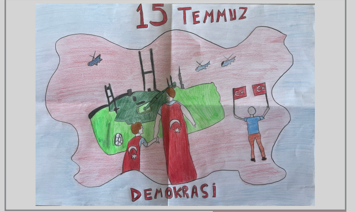
Emel Sude BAĞCI / 7D

15 Temmuz gecesi eşim ve çocuklarımla evde oturuyordum. Televizyon kanallarında Boğaziçi Köprüsü'nün tanklar tarafından kapatıldığı haberleri vardı. Kanalları değiştirmeye devam ettim. Haberlerde darbe girişiminde bulunduğu söyleniyordu. TRT kanalı açtığımda kadın sunucunun darbe bildirisini okuduğunu gördüm. Ailemi, çocuklarımı, geleceğimi, ülkemi düşündüm. Darbenin gerçekleşmesini istemediğim için ne yapabileceğimi düşünmeye başladım. Bir an önce kendimi sokağa atmak istedim ve dışarı çıkmak için hazırlandım. Ailemle vedalaştım. Tam sokağa çıkacağım esnada, arkadaşım beni aradı. Cumhurbaşkanımız bir televizyon kanalında cep telefonundan görüntülü görüşme ile halkın sokağa çıkması gerektiğini söylemiş. Ben zaten hazırdım. Arkadaşım geldi yola çıktık. Köprü yolu kapalıydı. Bir mahşeri insan kalabalığı... Bu arada F 16 uçakları üzerimizden alçak geçiş yaptılar. Çok güçlü bir patlama sesi meydana geldi. Herkes kendini aniden kendini yerlere attı. Bayılmışım. Gözümü açtığımda bir hastane odasıydım. Yaralanmışım. Yanımda eşim vardı. İlk sorum darbenin gerçekleşip gerçekleşmediği oldu. Gerçekleşmediğini